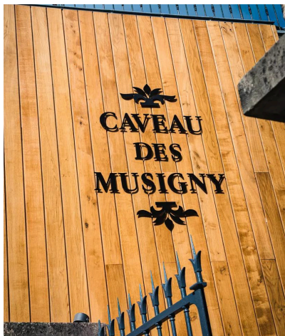
Le Caveau des Musignys à quelques pas de l'hôtel (fermé le lundi en basse saison)

Pour acheter du vin à proximité de l'Hôtel: