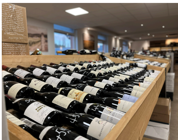
Les Bons Plans du Vin à Fixin (fermé le lundi)