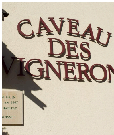
Le Caveau des Vignerons à Morey-Saint-Denis (fermé le dimanche et le lundi matin)