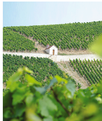
Les Grands Bourgognes à Brochon (fermé le dimanche)