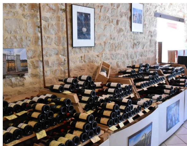
La Cave Jacques François à Nuits-Saint-Georges (ouvert tous les jours)